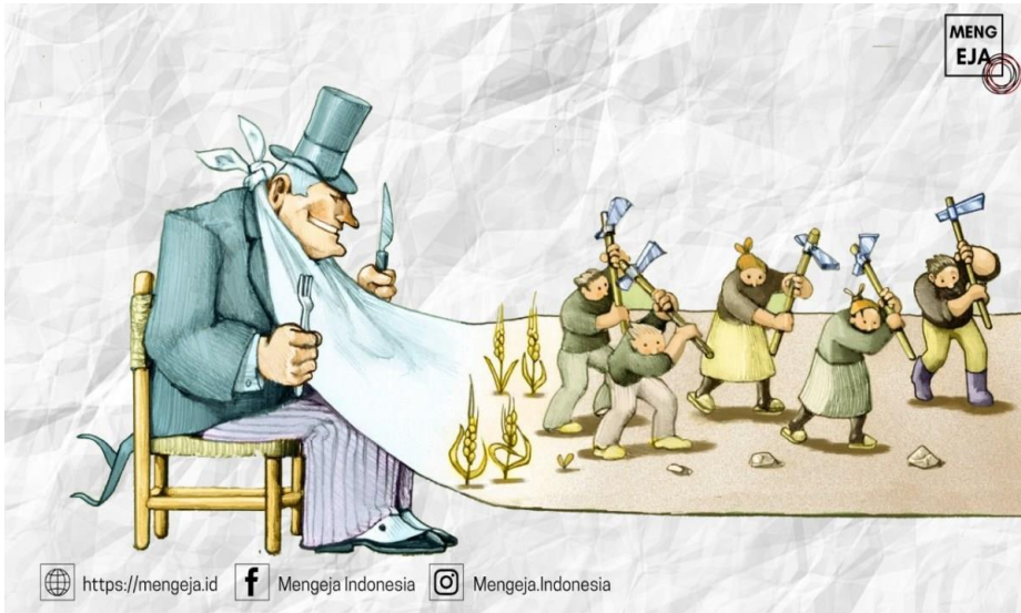
Gambar 3. Paradigma Marxisme