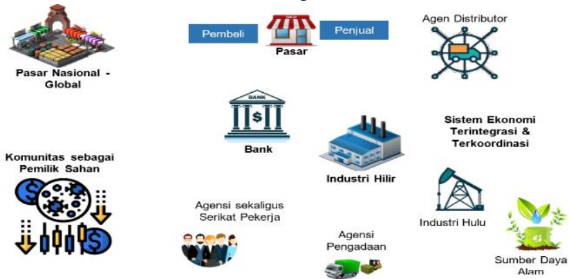
Gambar 4. Peran Negara dalam Pasar