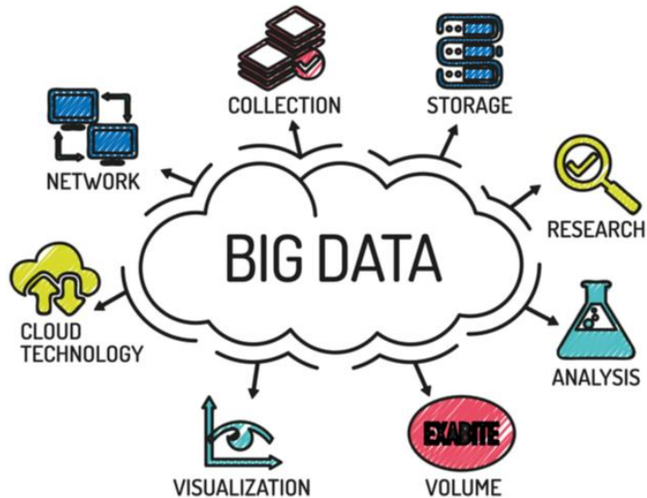
Gambar 3. Big Data